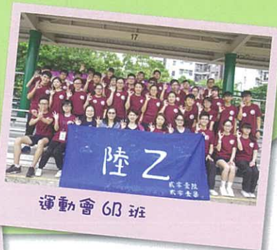
運動會 6B 班