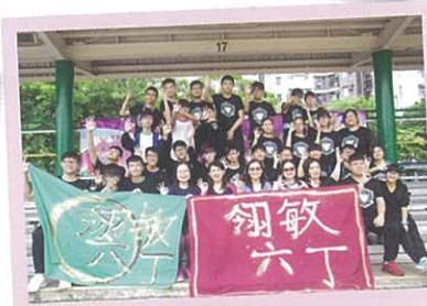
運動會 6D 班