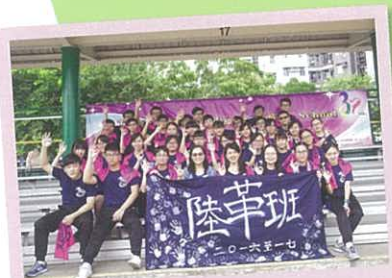
運動會 6A 班