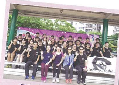
運動會 6C 班