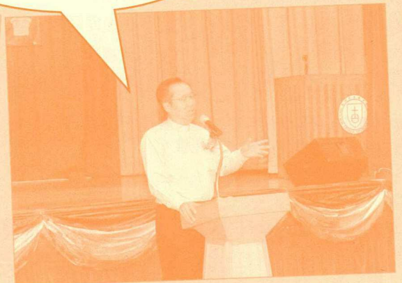
第十屆全體會員大會 校長致辭